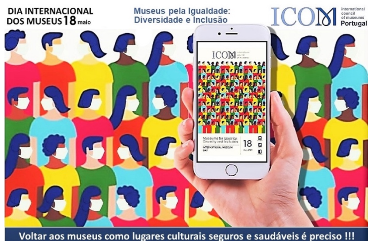
Cartaz do Dia Internacional dos Museus – 18.05.2020