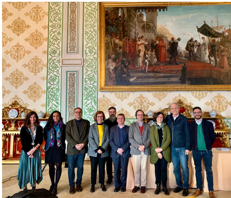
Membros da anterior e nova direção do ICOM Portugal após o ato eleitoral