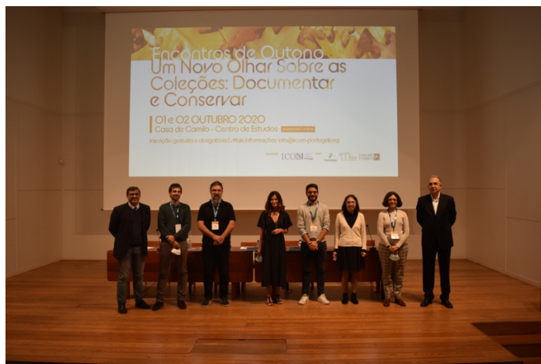
Encontros de Outono 2020

Em 2020 (janeiro a dezembro), aderiram 36 novos membros individuais (dos quais 16 membros estudantes e 20 regulares) e 2 membros institucionais.