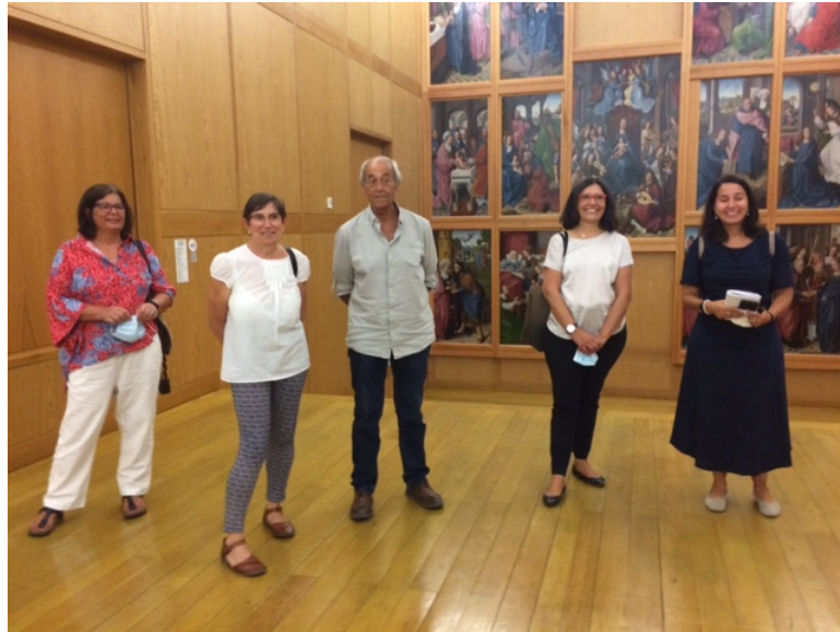
Visita ao Museu Nacional Frei Manuel do Cenáculo – Évora – 3 de setembro 2020