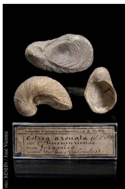
Exemplares da Colecção D'Orbigny, oferecida em 1855 pelo paleontólogo francês Alcide d'Orbigny a D. Pedro V

É claro que um empreendimento desta dimensão não pode deixar de agradar, e muito, à autarquia, carente que está de fundos. Do mesmo modo, receio que também esteja a ser visto pela Universidade como uma promessa de financiamento para fazer face às suas múltiplas carências. Sei, pelo que ali se fez e pelo que ali existe de capacidade para fazer, todo o espaço do grande edifício não seria de mais para albergar um Museu de Ciência pleno de vitalidade e um Museu de História Natural digno de um país que abriu o mundo à Europa dos séculos XV e XVI, uma instituição com século e meio de investigação e ensino que, não obstante a exiguidade orçamental de sempre, ultrapassou dificuldades e conquistou um lugar de merecido destaque no panorama nacional.