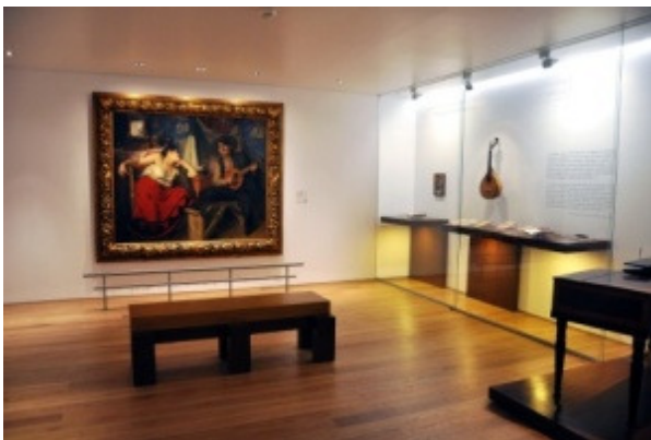
Museu do Fado, Circuito Expositivo - O Fado , 1910, José Malhoa, óleo s/tela, 151 x 186 cm, Coleção Museu da Cidade, Câmara Municipal de Lisboa.

Neste sentido, duas premissas assumiam importância central no planeamento do projecto museográfico: a extensão do circuito expositivo aos três pisos do edifício e o abandono do conceito da recriação cenográfica de ambientes, ele próprio suscitando constrangimentos espaciais e informativos ao visitante.