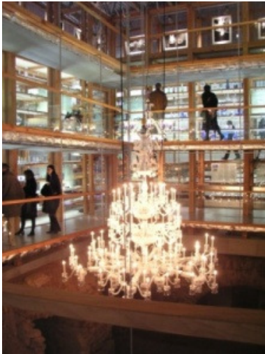
Membros do ICOM Glass durante a visita a La Grande Place - Musée du Cristal, em Saint - Luis - lès - Bitche.

decoreção original. A Câmara de Comércio, com os vitrais de Jacques Gruber, e o Musée Lorraine , foram também objecto de visitas.