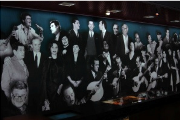
Museu do Fado, Circuito Expositivo, papel de parede (pormenor) retratando os protagonistas do fado.

Sombras no Museu Nacional de Etnologia, inaugurava-se a perspectiva de musealização do fado, com inequívoco rigor e qualidade científicos. 5