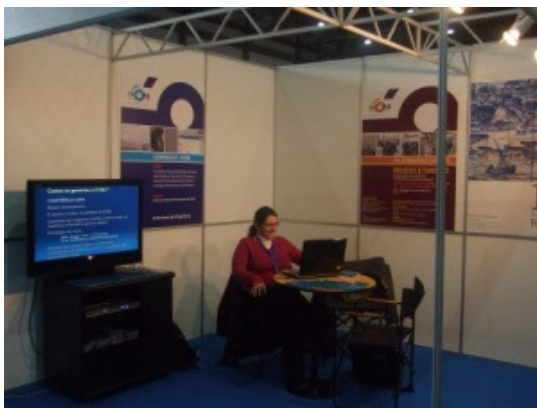
Perspectiva do stand do ICOM-PT no TEMPUS.

A Comissão Nacional Portuguesa do ICOM (ICOM-PT) associou-se à 2. a edição do Fórum Cultura e Criatividade (FCC09) , o 1. o evento oficial do Ano Europeu da Criatividade e Inovação, promovido pela Agência Inova e decorrido na Exponor – Feira Internacional do Porto, de 4 a 8 de Fevereiro de 2009. Mais concretamente, integrou o TEMPUS - Salão Internacional dos Museus e do Património, desenvolvendo algumas actividades: