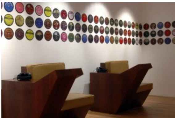
Museu do Fado, Circuito Expositivo - Área de consulta interactiva da base de dados do Museu.

No intuito de incrementar significativamente a qualidade e a quantidade de informação prestada ao visitante, permitindo a sua constante actualização e renovação, o discurso museográfico contemplou ainda uma componente multimedia interactiva, 18 suscitando uma leitura multidisciplinar sobre esta prática performativa, viva e dinâmica, estruturada, ontem como hoje, em torno do diálogo sistemático entre as tradições do passado, evoluções tecnológicas e processos de mediatização e as abordagens das novas gerações .