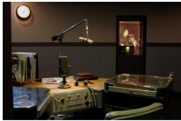
Museu do Fado - Instalação "No Ar" (pormenor), estúdio de gravação e emissão da Emissora Nacional, Coleção RTP/RDP.

Paralelamente, a necessidade de integração de novos acervos museológicos, sedimentando uma mais cabal representação dos artistas, ao longo da própria exposição, suscitavam uma narrativa museográfica na qual a interpretação da história do fado – intrinsecamente ligada, como sabemos, à evolução da cidade de Lisboa e às inovações tecnológicas trazidas pela rádio, a gravação discográfica, o cinema e a televisão – viria a ter lugar numa perspectiva de leitura multidisciplinar do género, somando ao objecto do quotidiano – ao instrumento, ao folheto, ao repertório – as representações emblemáticas do tema das nossas artes plásticas e da nossa literatura.