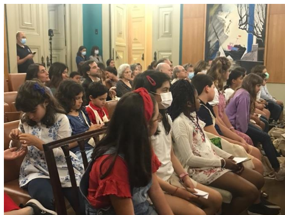
Sessão Comemorativa CMLisboa – 10 de maio 2022