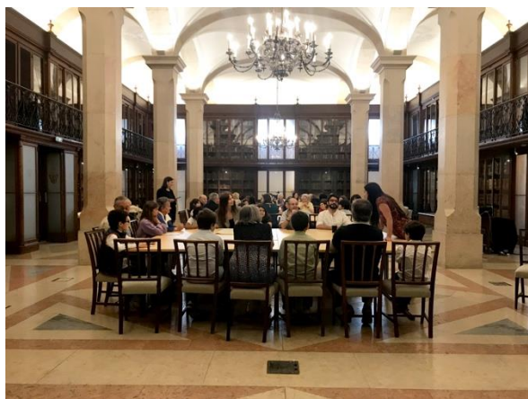
Sessão Comemorativa CMLisboa – 10 de maio 2022