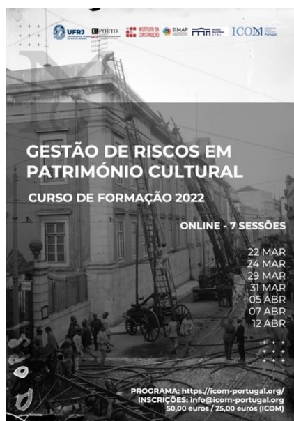
Cartaz Curso de Gestão de Riscos