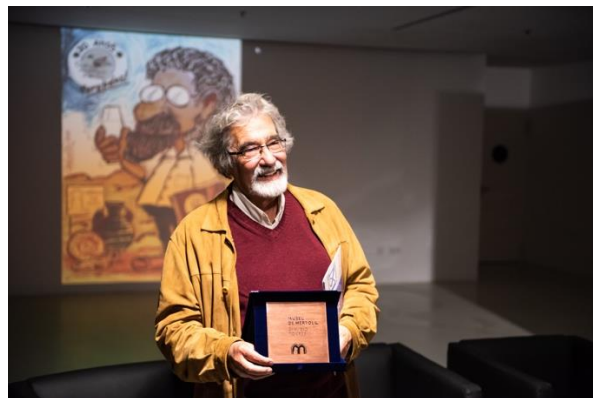
Encontros de Outono – Mértola – 18 de novembro 2022