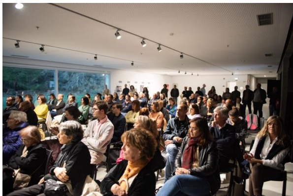
Encontros de Outono – Mértola – 18 de novembro 2022